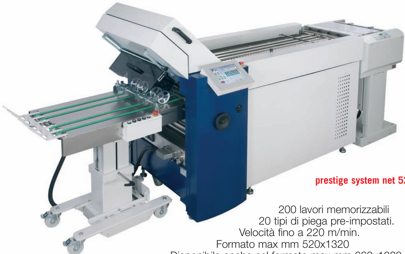
prestige system net 52/6 ART 52

I più automatici e moderni sistemi di piega collegabili a tutti i motori di stampa B/N e colore sia da cut sheet che da bobina. Interfaccia elettronica con tutti i serventi presenti sul mercato. Automatismi quali la regolazione della pressione dei rulli di piega, la chiusura/apertura delle tasche, il piano di collegamento e di messa in squadra della carta, permettono avviamenti e cambi formato rapidissimi facendo sì che questi sistemi siano la soluzione più veloce e flessibile per la produzione di segnature, stampati pubblicitari e direct mailing.