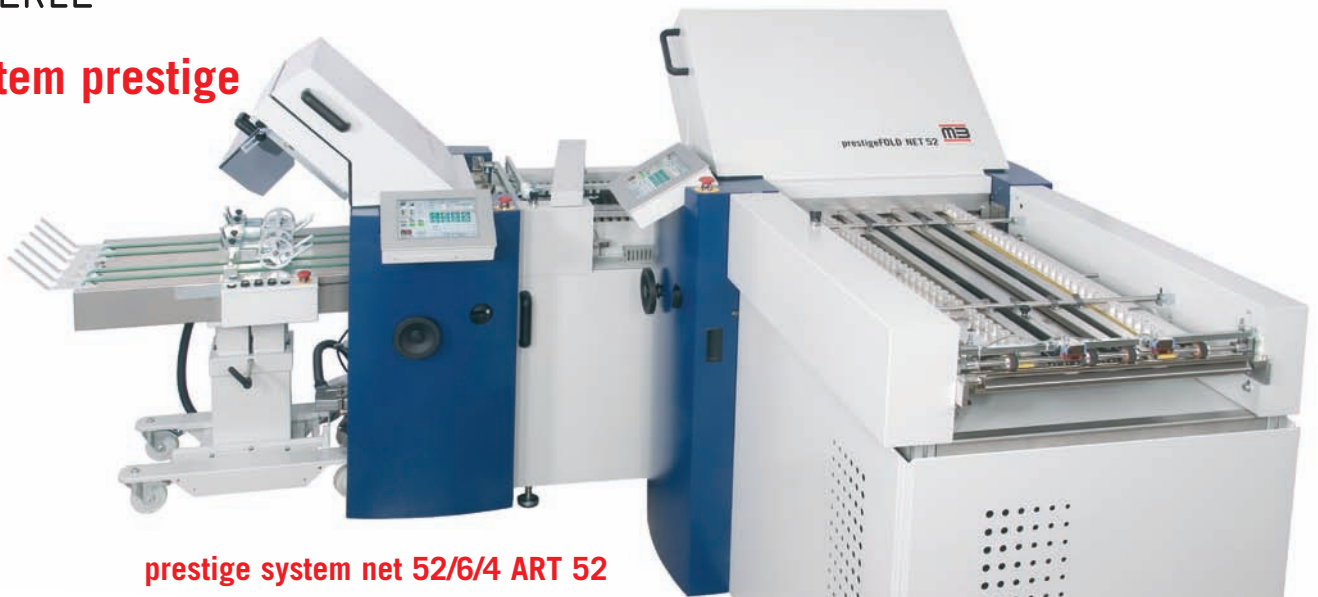
prestige system net 52/6/4 ART 52

I più automatici e moderni sistemi di piega collegabili a tutti i motori di stampa B/N e colore sia da cut sheet che da bobina. Interfaccia elettronica con tutti i serventi presenti sul mercato. Automatismi quali la regolazione della pressione dei rulli di piega, la chiusura/apertura delle tasche, il piano di collegamento e di messa in squadra della carta, permettono avviamenti e cambi formato rapidissimi facendo sì che questi sistemi siano la soluzione più veloce e flessibile per la produzione di segnature, stampati pubblicitari e direct mailing.